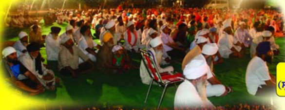
ਨਗਰ ਮਜਾਰਾ (ਸ੍ਰੀ ਅਨੰਦਪੁਰ ਸਾਹਿਬ)