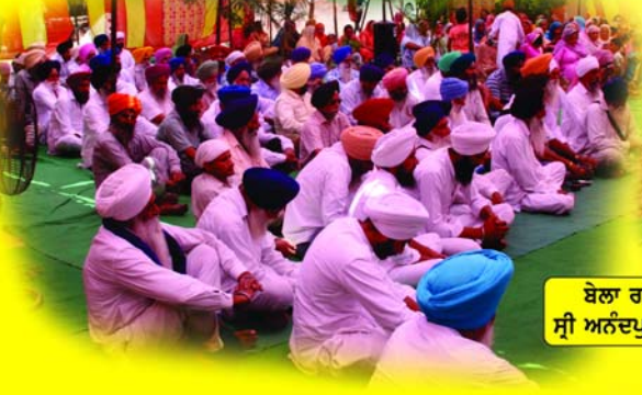
ਬੋਲਾ ਰਾਮਗੜ੍ਹ ਸ੍ਰੀ ਅਨੰਦਪੁਰ ਸਾਹਿਬ