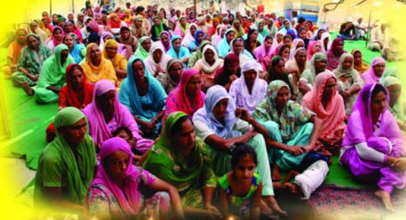
ਨਗਰ ਆਦੋਆਣਾ (ਨਵਾਂ ਸ਼ਹਿਰ)