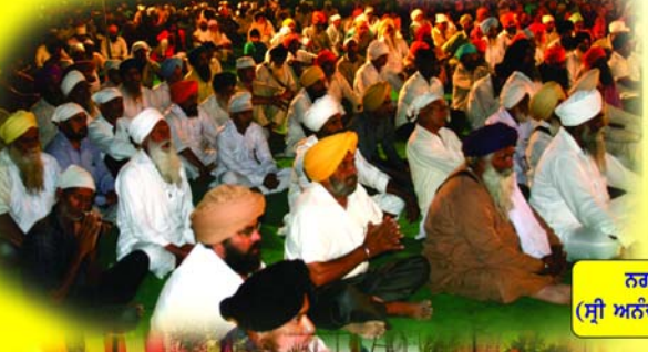
ਨਗਰ ਭੱਟੋਂ (ਸ੍ਰੀ ਅਨੰਦਪੁਰ ਸਾਹਿਬ)